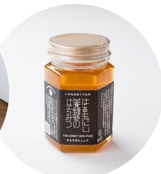
お菓子工房 はあもにい はちみつ・プリン詰め合わせ