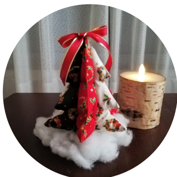
ソーイングカフェ*銀花 布クリスマスツリーキット