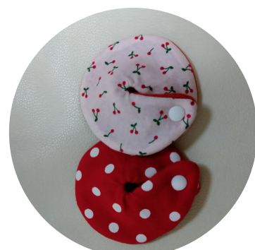
Alive-アライブ- ペグカバー