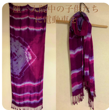
草木染 四季色優遊 (協賛講座・満員御礼)