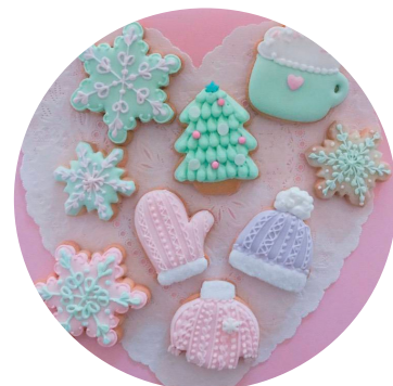
omekashi sweets アイシングクッキー