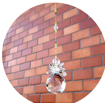
Beads Craft ~ivy~ サンキャッチャー